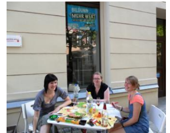
Bei schönen Wetter finden die ASF-Sitzungen draußen statt.